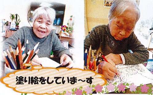
塗り絵をしています〜す