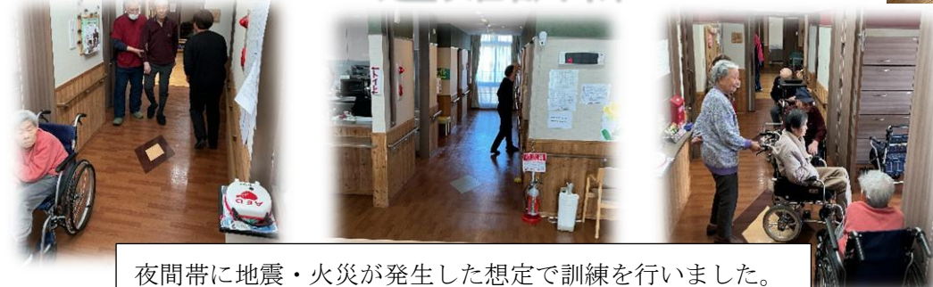
夜間帯に地震・火災が発生した想定で訓練を行いました。