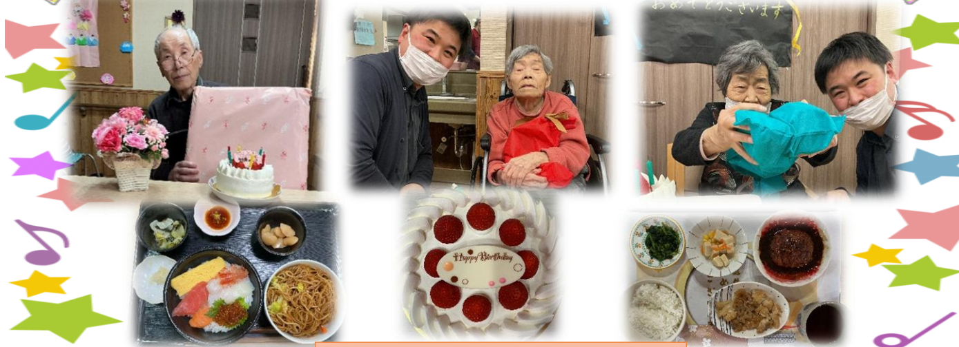
リクエストメニューを提供しました。 いつまでもお元気にお過ごしください