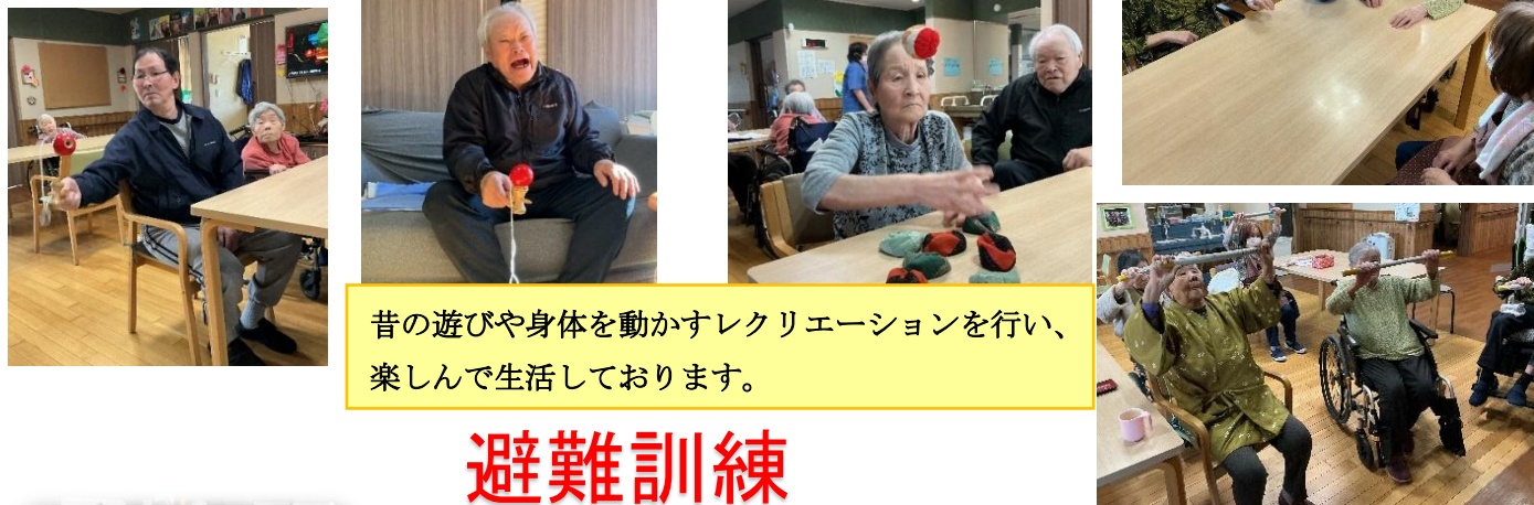
昔の遊びや身体を動かすレクリエーションを行い、 楽しんで生活しております。