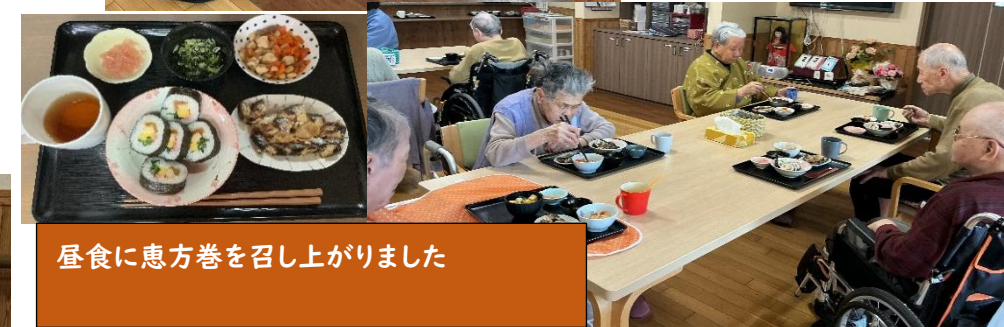
昼食に恵方巻を召し上がりました