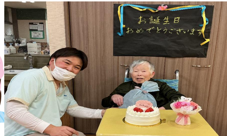
昼食にハンバーグ御膳、おやつにパースデーケーキを召し上がりました。