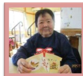
施設内の新年の壁面飾りも利用者様と制作しました。