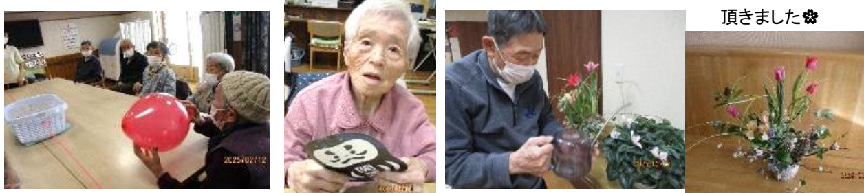
綺麗なお花を頂きました