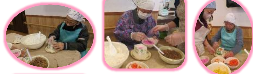
牛乳パックを使いました♪