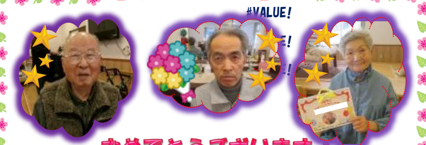
おめでとうございます!