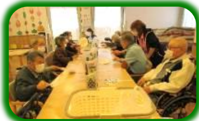
★寒さに負けるなうちわゲーム★