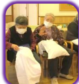
枕カバー入れ、 ありがとうございます♪!