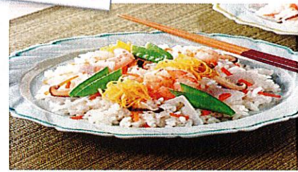
3月4日(火) ちらし寿司