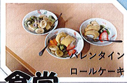
バレンタイン ロールケーキ