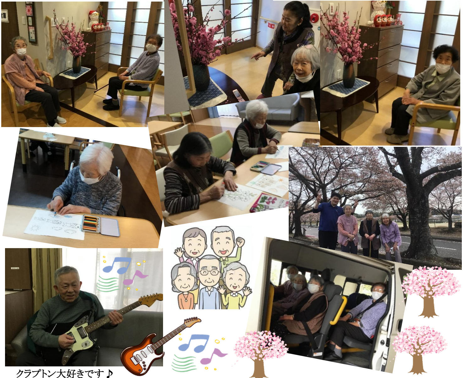
クラプトン大好きです♪

皆様、馴染みの方と談笑されたり体操やゲーム等、ご自分のペースで楽しまれています。