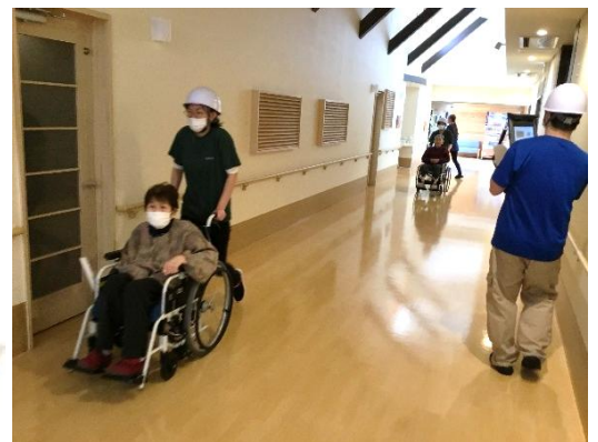
皆さん、慌てないで避難してください