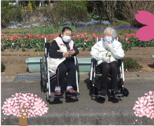
暖かくて気持ちいいね

暖かい日差しの中、近所の桜を見ながら散歩に出かけました。皆様、笑顔いっぱい で花見を楽しまれました。