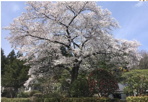
満開の桜～見事です