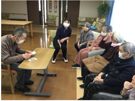
マジック披露～数字を当てます

皆様、馴染みの方と談笑されたり体操やゲーム等、ご自分のペースで楽しまれています。