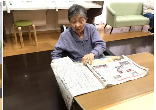
今日のニュースは何かな