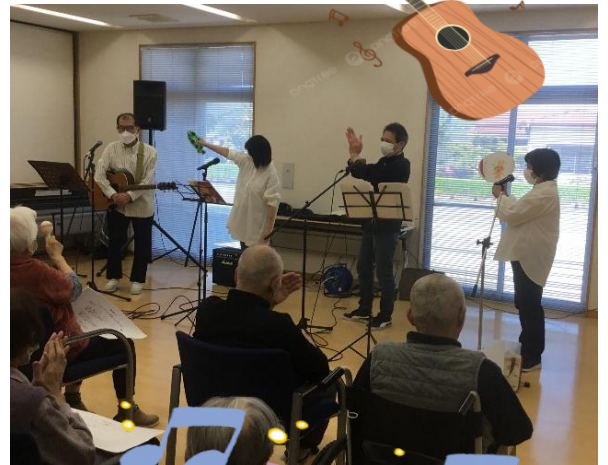
若いころ思い出すね♪