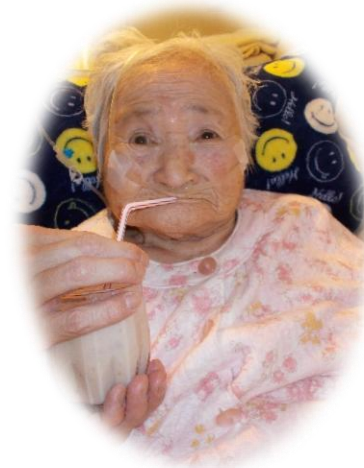
「一口でちょっと幸せになりますね」