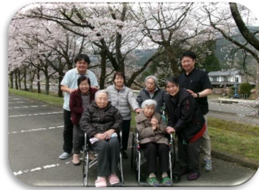
「この景色、今日だけのごほうびみたいです」

いつもグループホームの運営にご協力いただき、ありがとうございます。 4月となり、新しい年度がスタートしました。暖かい日も増え、ご入居者さまも散歩やレクリエーションを楽しんでおられます。 これからも、皆さまに安心してお任せいただけるよう、職員一同努めてまいります。どうぞ今年度もよろしくお願いたします。