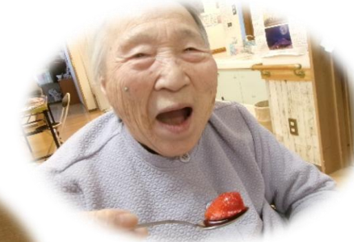
「甘い香りだけで笑顔になります」