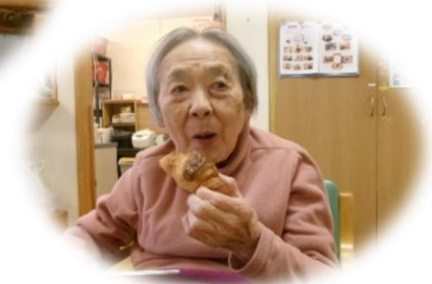
「今日はみんなで焼きたてパンを楽しむ日です。ゆっくり味わっていきましょう」