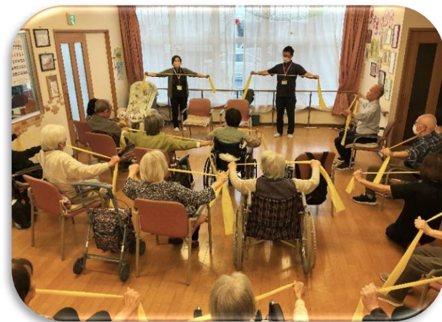
「伸ばして縮めて、今日も筋肉がよい仕事しました」