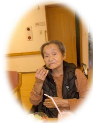
「飲むだけで元気が湧いてきそうです」