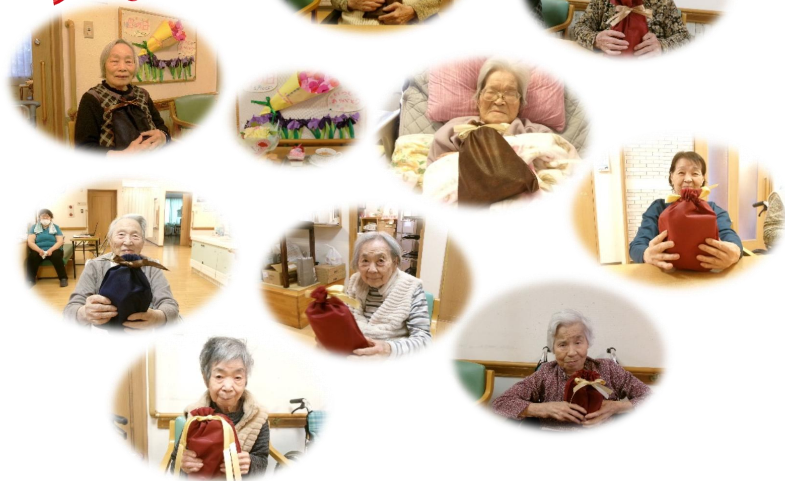
「皆さまの優しさに支えられています。いつも本当にありがとうございます」