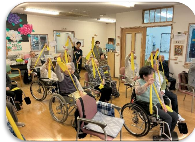
「みんなで声を合わせて、せーのっ！元気が広がる体操タイム」