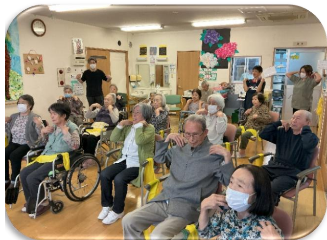
「肩がよく動くと、気持ちまで前向きに」