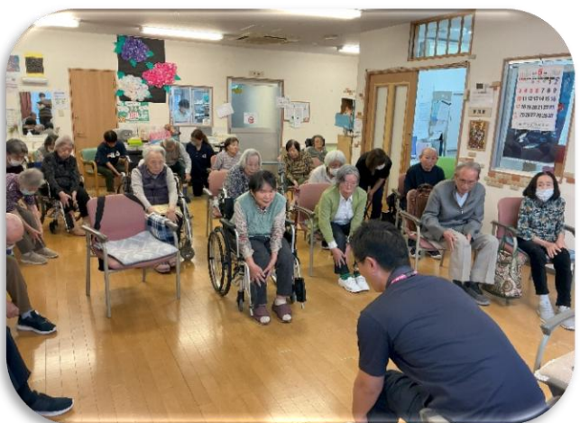
「ほぐれるたびに軽くなる。歩くのが楽しみになりそうです」