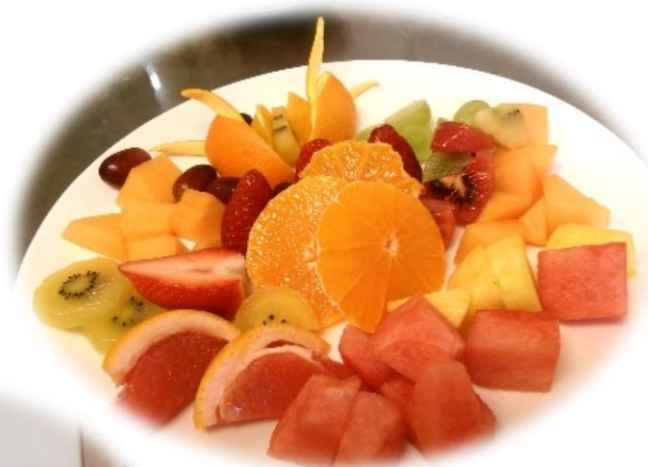
「色とりどりのフルーツをご用意しました。見ているだけで元気が出てきます」