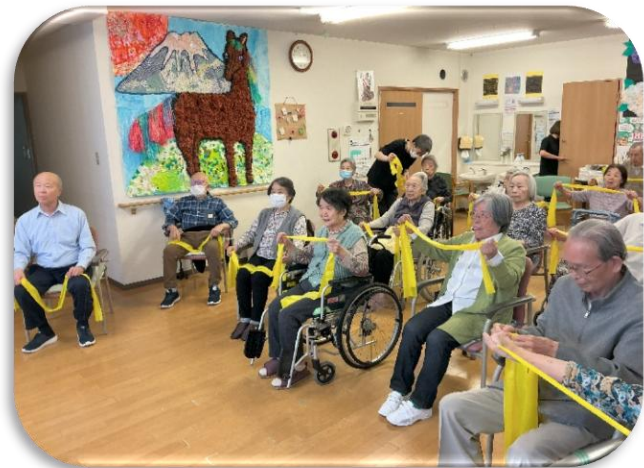
「動けば動くほど、笑顔も増量中」