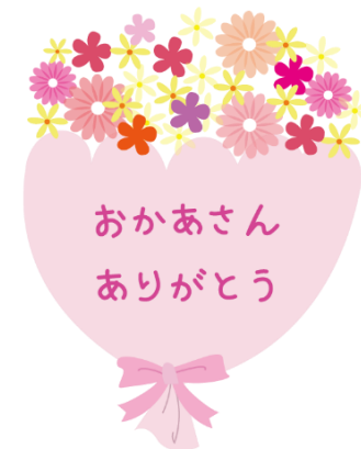
「皆さまの笑顔が、私たちの励みです。母の日、おめでとうございます」