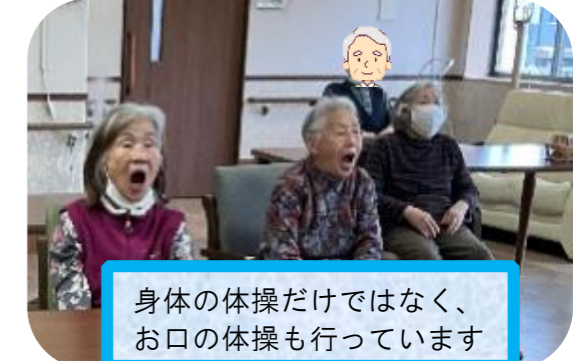
身体の体操だけではなく、お口の体操も行っています