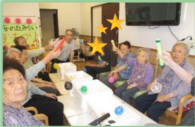
みんなではい！ちーす！ ヨーヨーをつりました～♪