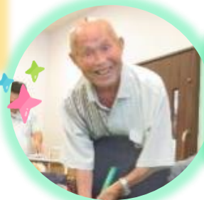
8月も素敵な笑顔をいただきました◎