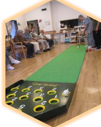
ボールを打って、点数を競いました♪