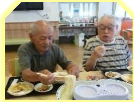
流しそうめん♪ 暑い夏には最高です★