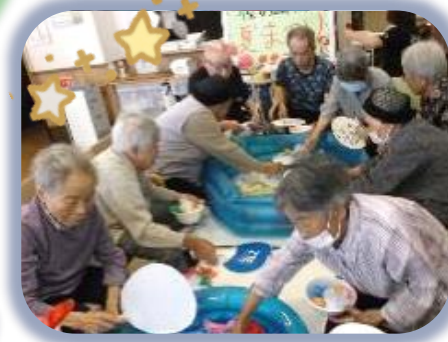
ペットボトルキャップで作った金魚を、うちわですくいました。皆さん必死です♪