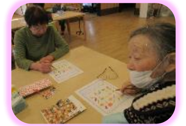
＼ピンゴ～♪ / ★ピンゴゲーム★