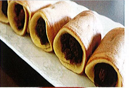
5月20日(水) あんこロール巻き