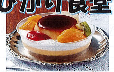
5月12日(火) プリンアラモード