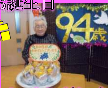
おめでとうございます