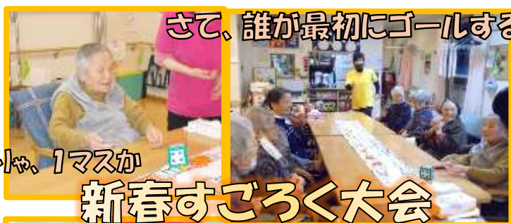
さて、誰が最初にゴールするか...

面会に関しても今はまだ解除は出来ませんので今しばらくご家族様にご理解を頂きご協力をお願いいたします。