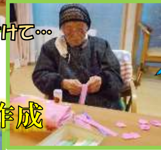
まかせてくんつえ!