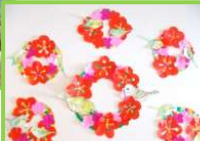
金山にも早く春が来ますように!