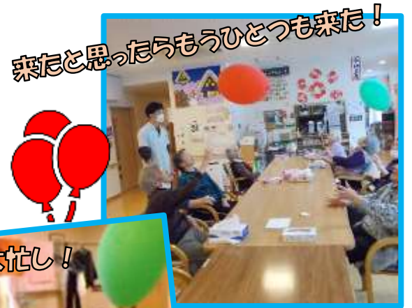
来たと思ったらもうひとつも来た!