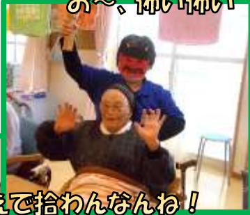
負けねえで拾わんなんね!