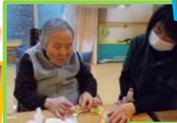
こうやって貼り付けて...