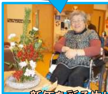
新年を彩る生け花