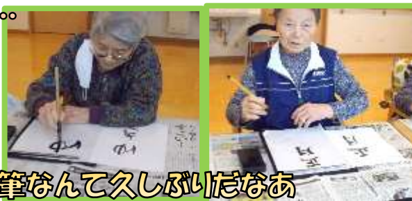
筆なんて久しぶりだなあ