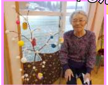
家ではもっと大きいのにさしてたよ