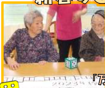
「万歳三唱」のマスに止まったぞ