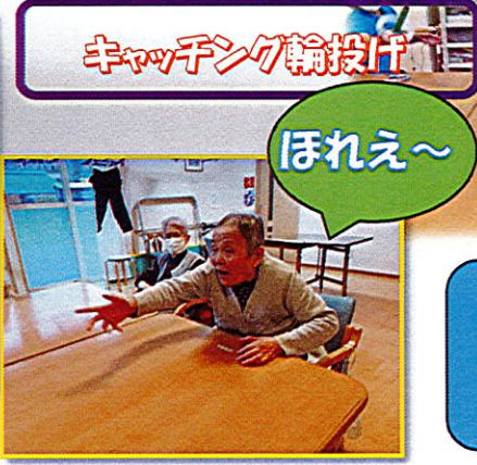
キャッチング輪投げ