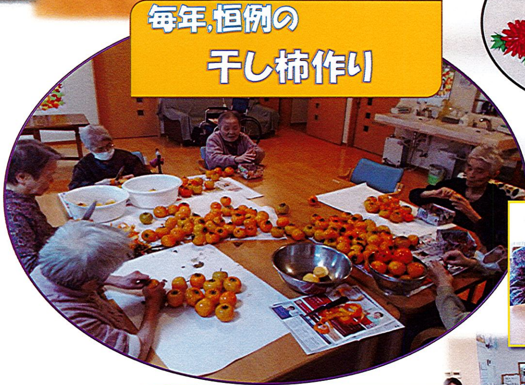
毎年恒例の 干し柿作り