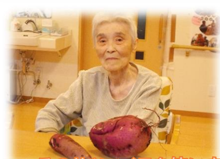
このサツマイモを使いました