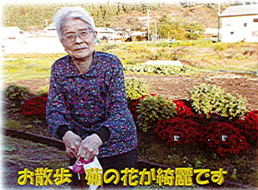
お散歩、菊の花が綺麗です

ついこの間まで暑かった気候でしたが、今年ももう師走の時期となり何となく気忙しく感じられます。1年の過ぎるのが本当に早いものですね。これからは雪の季節になってしまいますが利用者様と一緒に風邪に負ける事なく元気に楽しく過ごしたいと思います。インフルエンザの予防接種は11/26日に全員接種していただきました。これからもうがい・手洗い・消毒・換気をおこなって体調管理を徹底したいと思います。今年1年ご家族の皆様には大変お世話になりありがとうございました。来年もどうぞ宜しくお願い致します。