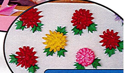
菊の花ができます