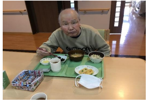
おかわりあるかな