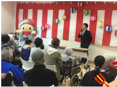
秋祭りを開催します