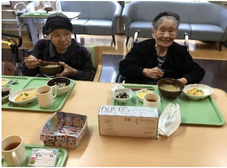
芋煮、あつたまるね

季節に合わせて、昼食に栗ご飯と芋煮汁を召し上がりました。皆様、旬な食事に満足されていました。