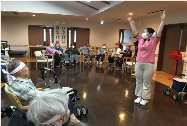
準備体操は万全に…