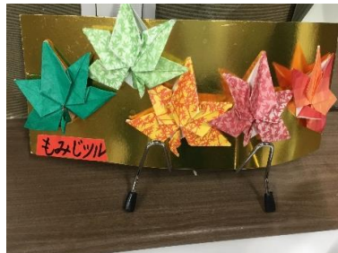
いつも素敵な作品ありがとうございます