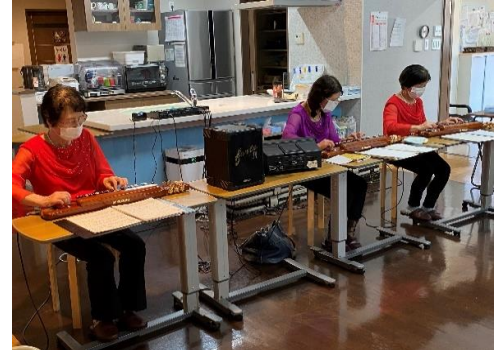
大正琴の音色に癒されます