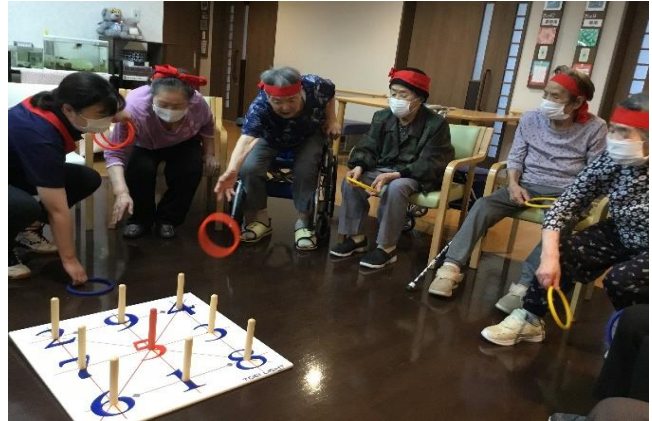
何点入るかな…それっ！