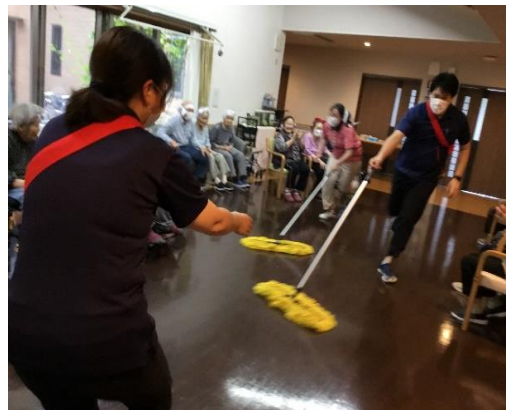
職員も真剣です、最後に勝ったのは…