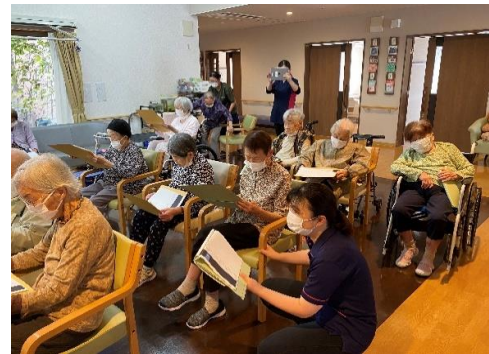
大正琴に合わせて歌いましょう