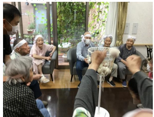
皆さん真剣です…えいっ！