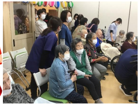
みんな踊り上手だね