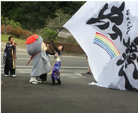
中島村のゆるキャラ、なかじぞうさん大活躍です