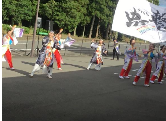
皆さん切れきれの踊り…お見事です！