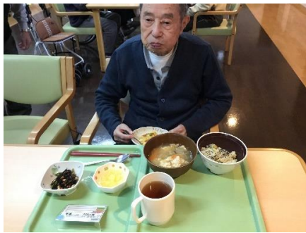
旬な野菜がたくさん入っていて美味しい