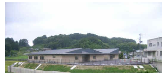
太陽を感じられるテラス