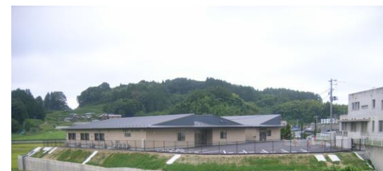
太陽を感じられるテラス