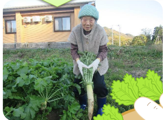
和の里農園にて大根掘りを行いました。