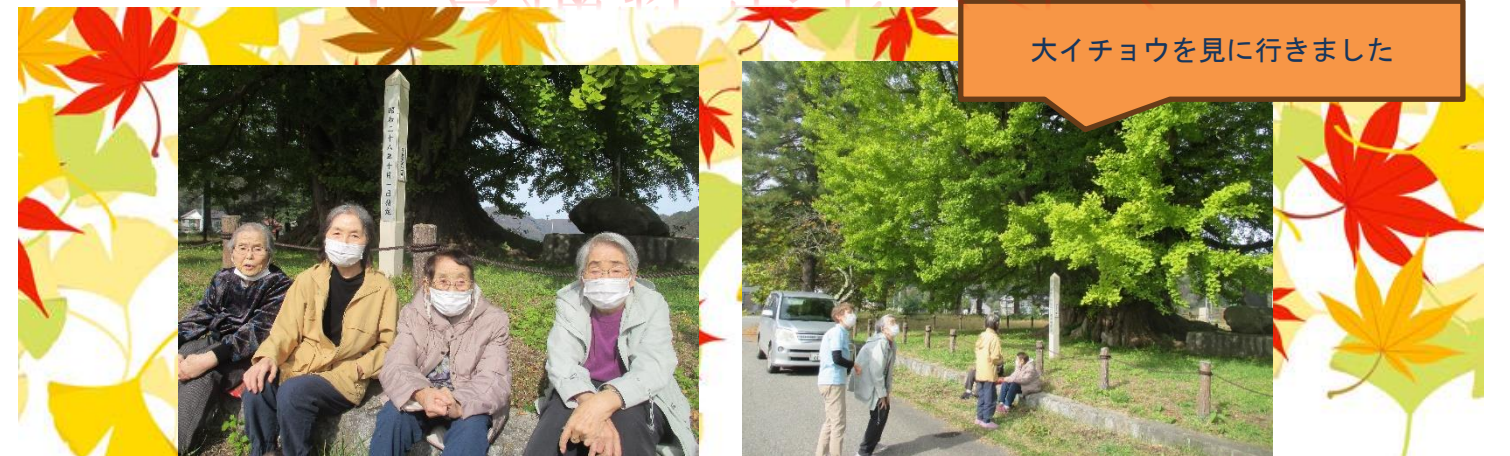
大イチョウを見に行きました