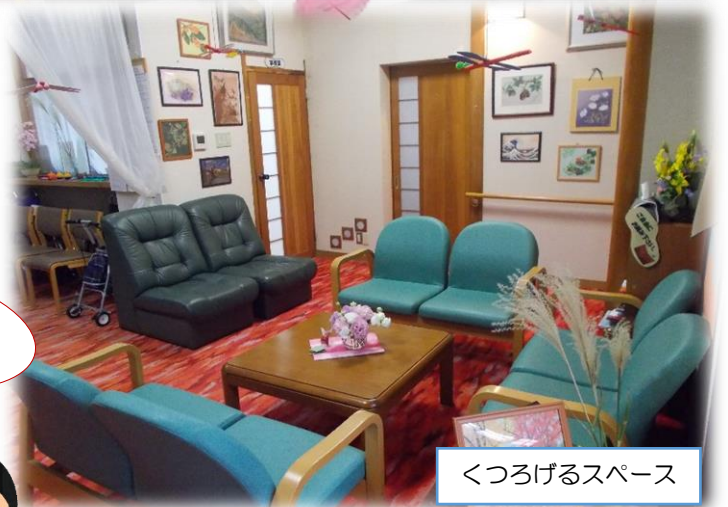
くつろげるスペース